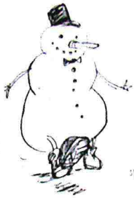
Marche de Nouvel An Neujahrsmarsch