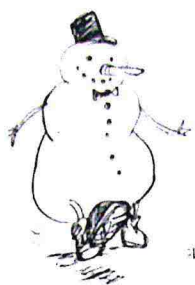
Marche de Nouvel An Neujahrsmarsch